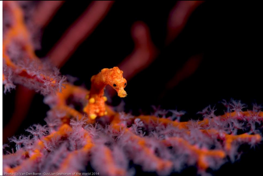
Guylian Seahorses of the World 2014