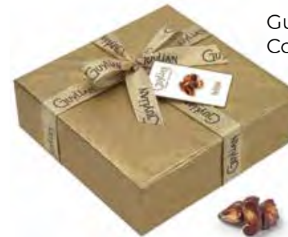
Gylian Zeevruchten Luxe Ballotin 500g Code: 218/905

Schenk het perfecte cadeau met deze wonderlijke Gylian geschenkverpakkingen. Ieder gevuld met de fijnste Belgische Pralines, het ideale geschenk.