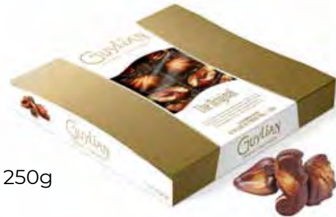
Guylian Zeevruchten 250g Code: 706/012