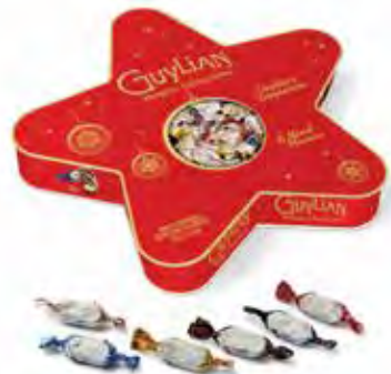
Guylian's Temptations Ster 135g Code: 636/009