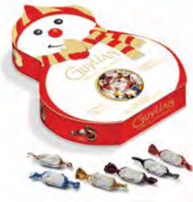
Guylian's Temptations Sneeuwman 135g Code: 635/012

Vier het einde van het jaar op de Guylian manier. Ontdek ons uniek Temptations assortiment in verrassende verpakkingen zoals een kerstboom of sneeuwman. Durf te verwennen en maak Kerstmis en Nieuwjaar extra zoet dit jaar.