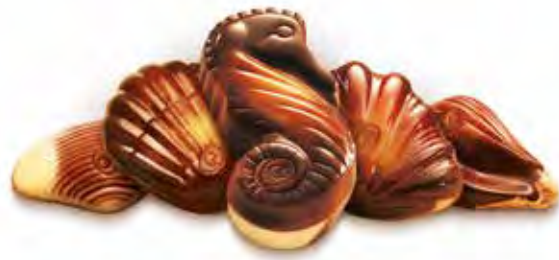
Guylian Zeevruchten 65g Code: 351/024

De Zeevruchten zijn Guylian's iconen. De vierkante doos heeft wereldwijd reeds ontelbare harten veroverd. De Zeevruchten zijn het ideale geschenk en een synoniem met Guylian. Elke praline is gevuld met de originele hazelnootpralinévulling.