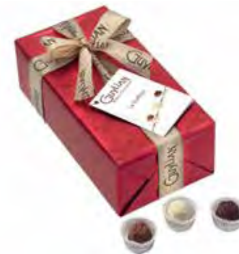
Gylian La Trufflina Luxe Ballotin 180g Code: 257/510