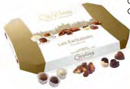
Gylian Les Exclusives 305g Code: 620/012

Geef een exclusieve variëteit aan smaken met "Les Exclusives". Heerlijke Zeevruchten, La Trufflina truffels en Opus pralines, verzameld in een luxueuze geschenkdoo.