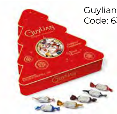
Guylian's Temptations Kerstboom 96g Code: 637/012