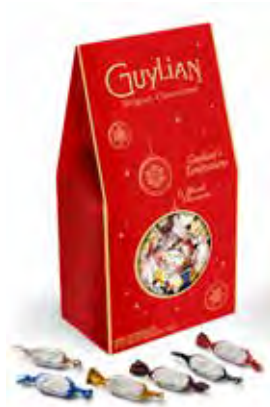
Guylian's Temptations Xmas 124g Code: 665/012

Vier het einde van het jaar op de Guylian manier. Ontdek ons uniek Temptations assortiment in verrassende verpakkingen zoals een kerstboom of sneeuwman. Durf te verwennen en maak Kerstmis en Nieuwjaar extra zoet dit jaar.