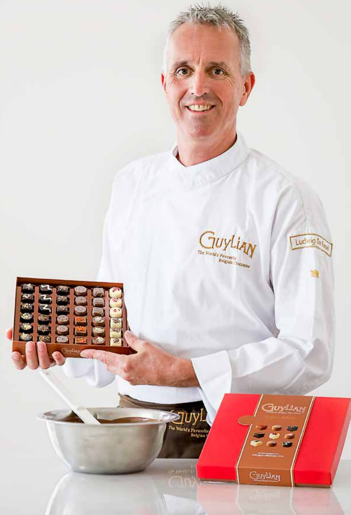
Guylian Master's Selection Goud 240g Code: 173/008