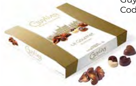
Gylian Le Gourmet 215g Code: 619/012

Geef het ultieme geschenk met onze heerlijke assortimentsdoo "Le Gourmet". Geniet of schenk een verzameling met Zeevruchten pralines en het Opus assortiment. Een luxueuze doo versierd met een afbeelding van de Brusselse grote markt waarin 19 premium chocolaatjes zitten.