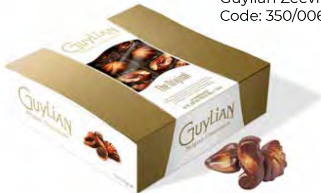
Guylian Zeevruchten 500g Code: 350/006