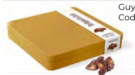
Guylian Zeevruchten Tin 250g Code: 352/012

Geef het meest luxueuze geschenk met onze prachtige tinnen dozen. Door de tinnen doos krijgt uw verpakking onmiddellijk een statige uitstraling. Binnenin kan je onze geliefde zeevruchten met originele hazelnoot pralinévulling, ons Opus assortiment of ons La Trufflina assortiment terugvinden.