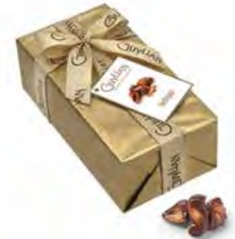
Gylian Zeevruchten Luxe Ballotin 250g Code: 206/910