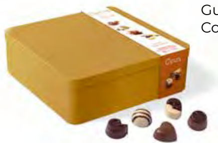
Guylian Opus Tin 360g Code: 273/006