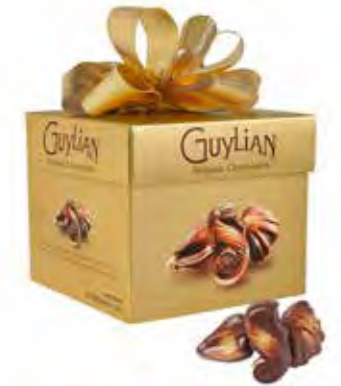
Guylian's Zeevruchten Luxe Cube Box 195g Code: 212/006

Schenk de ultieme verrassing met onze Guylian's Temptations collectie. Onze selectie van de fijnste Belgische Chocolaatjes, gemaakt met 100% pure cacaoboter.