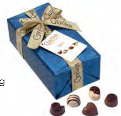
Gylian Opus Luxe Ballotin 180g Code: 270/910