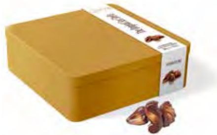
Guylian Zeevruchten Tin 500g Code: 707/006