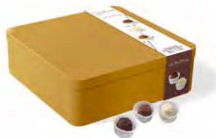
Guylian La Trufflina Tin 360g Code: 255/506