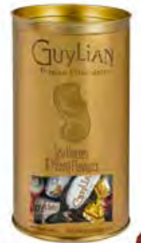
Guylian's Temptations Tubo 316g Code: 643/006