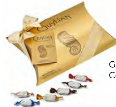
Guylian's Temptations Pillow Pack 183g Code: 663/005