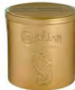
Guylian's Temptations Tin 278g Code: 664/008